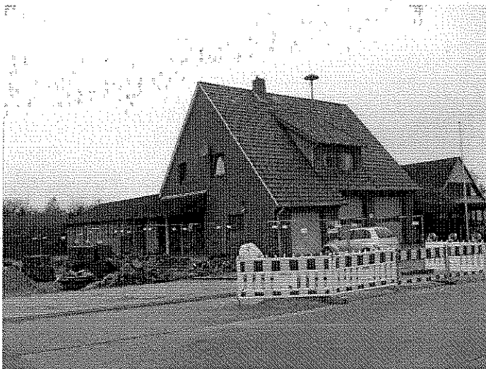
Feuerwehrhaus / Mühlenstraße